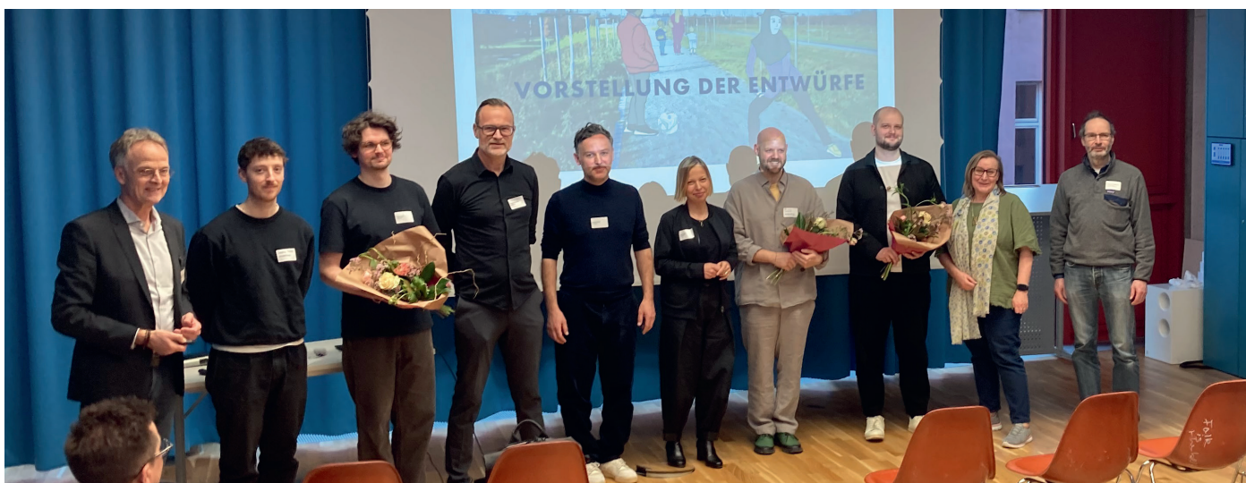
Ehrung der Preisträger*innen

Im Anschluss an die Ergebnisvorstellung reflektierten die Planungsteams ihre Eindrücke aus den Gesprächen mit den Teilnehmenden. Alle drei Teams betonten, dass sie die Weiterentwicklung des Friedrich-Parks und des Bewegungsparcours als Prozess verstehen, der auch im