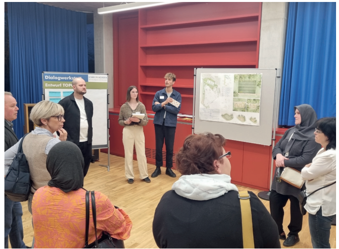
Kleingruppenphase zum Entwurf von TOPOTEK 1