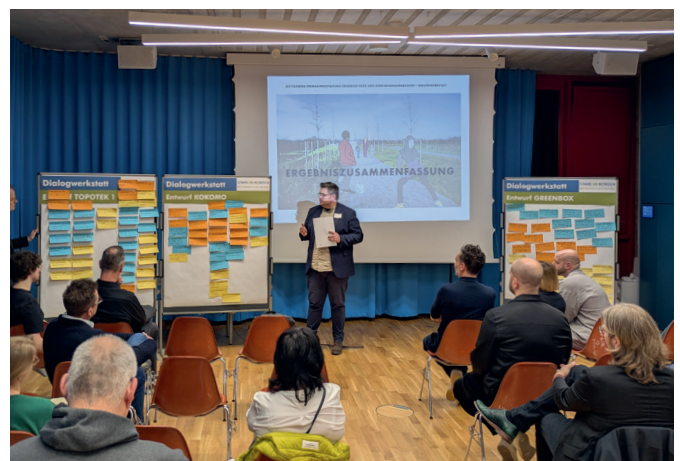
Vorstellung der Ergebnisse aus der Aktivphase