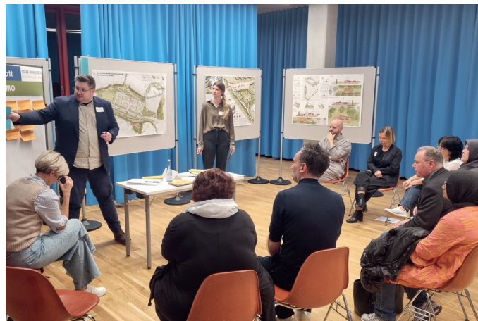
Kleingruppenphase zum Entwurf von KOKOMO

Qualität hervor, dadurch Erwartung einer sichtbaren Aufwertung des Stadtteils.