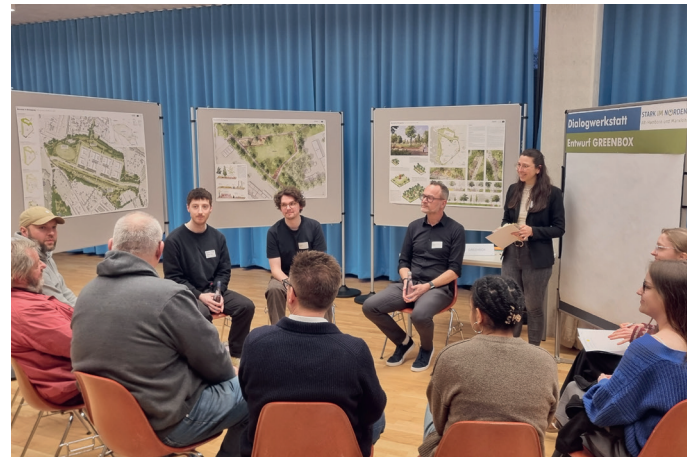
Kleingruppenphase zum Entwurf von GREENBOX